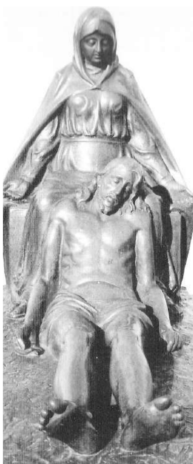
La "Deposizione" nella cappella Baio, opera dello scultore Strinati

Interessante anche la singolare ambientazione architettonica, un arco con l'epigrafe: "Incipit vita nova"; con il nome dello scultore abbreviato, quasi per pudore, nella sigla: "S.ti C.lo" (Strinati Carlo), accanto al nome bene evidente del marmista che aveva fornito il materiale. Strinati era fatto così. Il suo nome sui giornali della prima metà del '900 appariva fra gli autori delle sculture più apprezzate e vorrei qui ricordare quale esempio il "Gesù depresso" (due figure a tutto tondo) nella cappella Baio del 1° reparto. L'attività artistica di Carlo Strinati è poi ricordata in un'attenta e elegante monografia di Mariagrazia Strinati edita lo scorso anno dalla Fondazione di Piacenza e Vigevano".