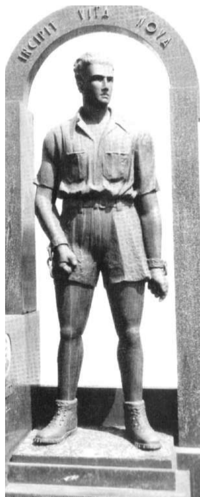
Il monumento al partigiano Giannino Bosi, opera dello scultore Strinati