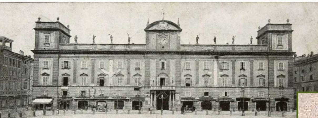
PIACENZA - Palazzo della Pretura

Cordiale ricambio di affettuosi saluti Pasina M